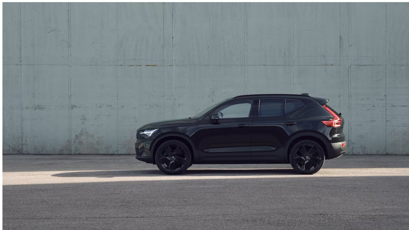
XC40 Black Edition Plus Exteriér

Pomocí tohoto kódu můžete svůj návrh sdílet s prodejcem Volvo